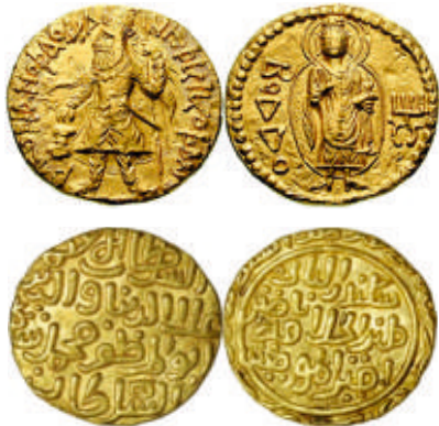
हिन्द-यवन शासक मेनाण्डर के सिक्के

दर्शन के सम्बन्ध में कई सूक्ष्म प्रश्न नागसेन से पूछे और सभी प्रश्नों का उसने सन्तोषजनक उत्तर दिया। परिणामस्वरूप मेनाण्डर बौद्ध बन गया।